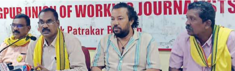
सुविधांमध्ये असमानता आहे, दिलेल्या अधिकारांच्या अंमलबजावणीसाठी कटिबद्ध राहू, सर्वसामान्यांचे हीत जोपासण्यास आमची प्राथमिकता असेल, असे विकासबरोबरच संविधानाने